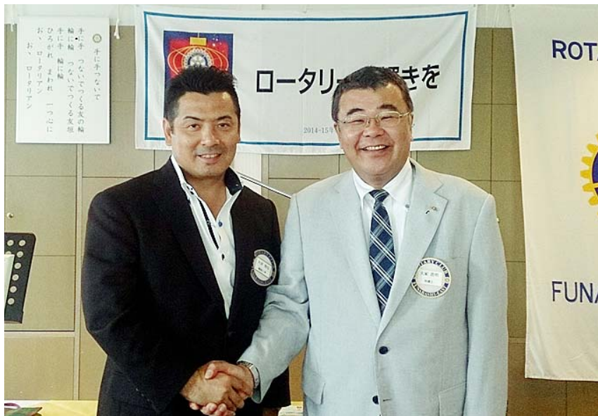
新会長と旧会長バッチ交換